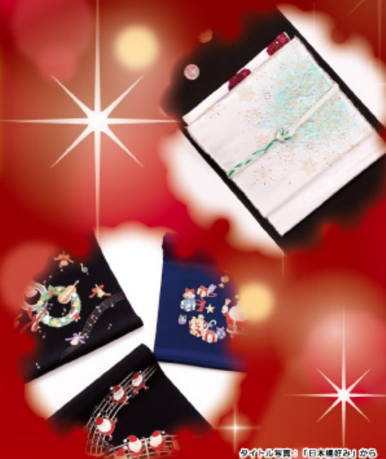
タイトル写真：『日本編好み』から