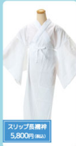
スリッパ長襦袢 5,800円(税込)