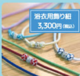
浴衣用飾り紐 3,300円(税込)

夏に向けての準備は いかがですか? キモノ生活を少しでも 涼しく快適に! 浴衣のおしゃれを楽しむ 小物も勢揃い!