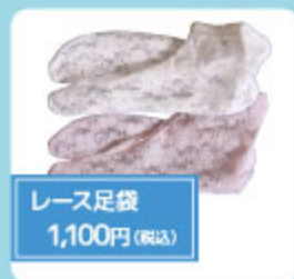
レース足袋 1,100円(税込)