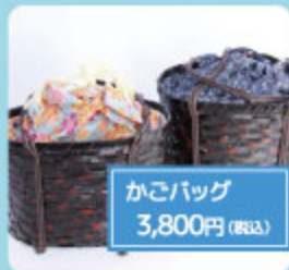
かごバッグ 3,800円(税込)