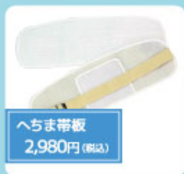
へちま帯板 2,980円(税込)