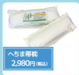
へちま帯枕 2,980円(税込)