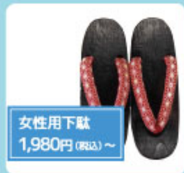
女性用下駄 1,980円(税込)~