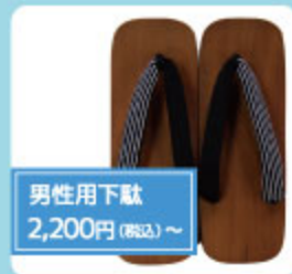
男性用下駄 2,200円(税込)~