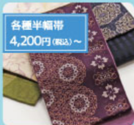
各種半幅帯 4,200円(税込)~