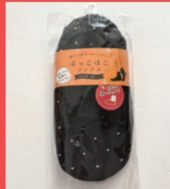
ほっこほこソックス