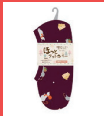
ほっとフットカバー